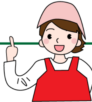
《 保育園児1人あたりの栄養摂取量 》